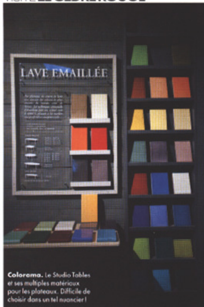
Colorama. Le Studio Tables et ses multiples matériaux pour les plateaux. Difficile de choisir dans un tel nuancier !