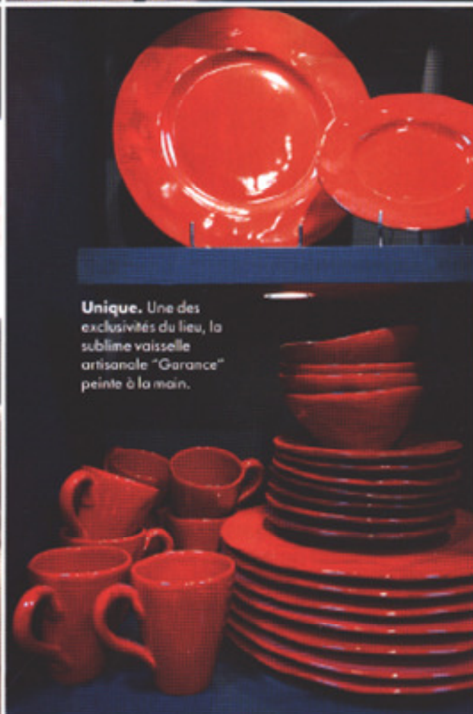
Unique. Une des exclusivités du lieu, la sublime vaisselle artisanale "Garance" peinte à la main.